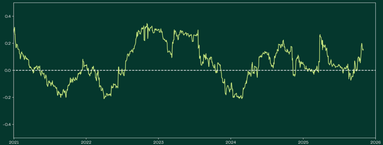
Figuur 1: de 90-daagse correlatie tussen de bitcoin- en goudprijs sinds begin 2021.